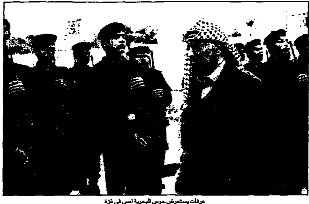
عزراة يستعرض حرس البحرية ايس في غزة

القدس - القدس العربي من عبد الرؤوف ارناؤوط لدى قرار الكونغرس الاسرائيلي الأخير بتبكير الانتخابات الاسرائيلية في وقت تتخبط فيه الإدارة الأمريكية بازمتها مع العراق والانشغال بالقرصنة الأمريكية على خطوطها الداخلية في الخليج والضغط على السلطة الفلسطينية في روطه على الاتفاق عليها ولا يري حتى للسلطة الفلسطينية مخرجاً منها في الأمد القريب.